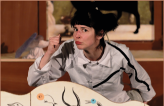
Théâtre visuel, théâtre d'objets