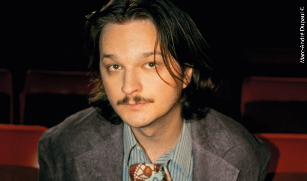
Marc-André Dupaul ©

En 2020, suite à l'élagage d'une haie obscure à côté de chez moi, je découvre une serre abandonnée, la serre de Gilbert, mon voisin. Je décide d'explorer le lieu au fil des saisons, au fil de son évolution. À travers les vitres ternes, les carreaux cassés, la porte entrouverte, je saisis le vivant. La nature est envahissante, sauvage et belle.